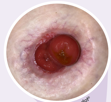
Vor eakin dot®