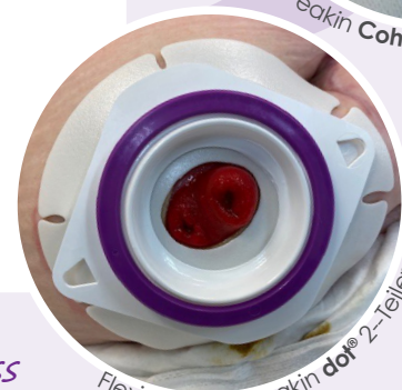
Flexi-konvexer eakin dot® 2-Teiler