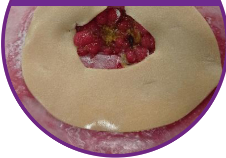
Sicheres Anlegen des großen Cohesive® Hautschuttrings