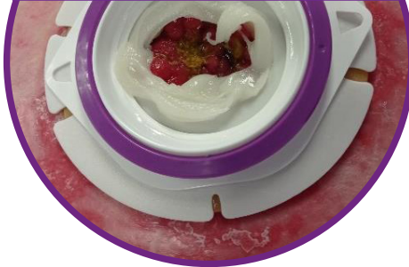
Anwendung der eakin Cohesive® Hautschutzpaste für noch mehr Sicherheit