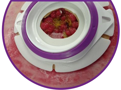
Anbringen der Basisplatte