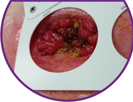
Exaktes Ausmessen des Stomas